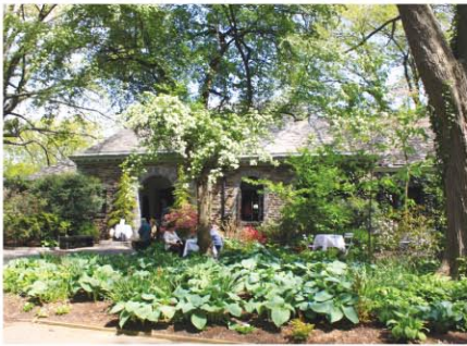
フォートライオンパークの中にあるレストラン「New Leaf Restaurant & Bar」は、1930年開業の老舗。

ニューヨーク州公認不動産エージェント。金融業界(15年)と不動産投資家(22年)としての経験を生かし物件探しの手伝いをする。ヨガ歴18年。瞑想(めいそう)、指圧、ヒーリングの経験も長い。natsuko@space-ms.com / www.space-ms.com / Nlkegami